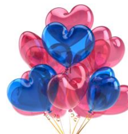
Thomás de Aquino